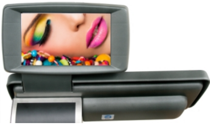
Display lato cliente ad elevate prestazione