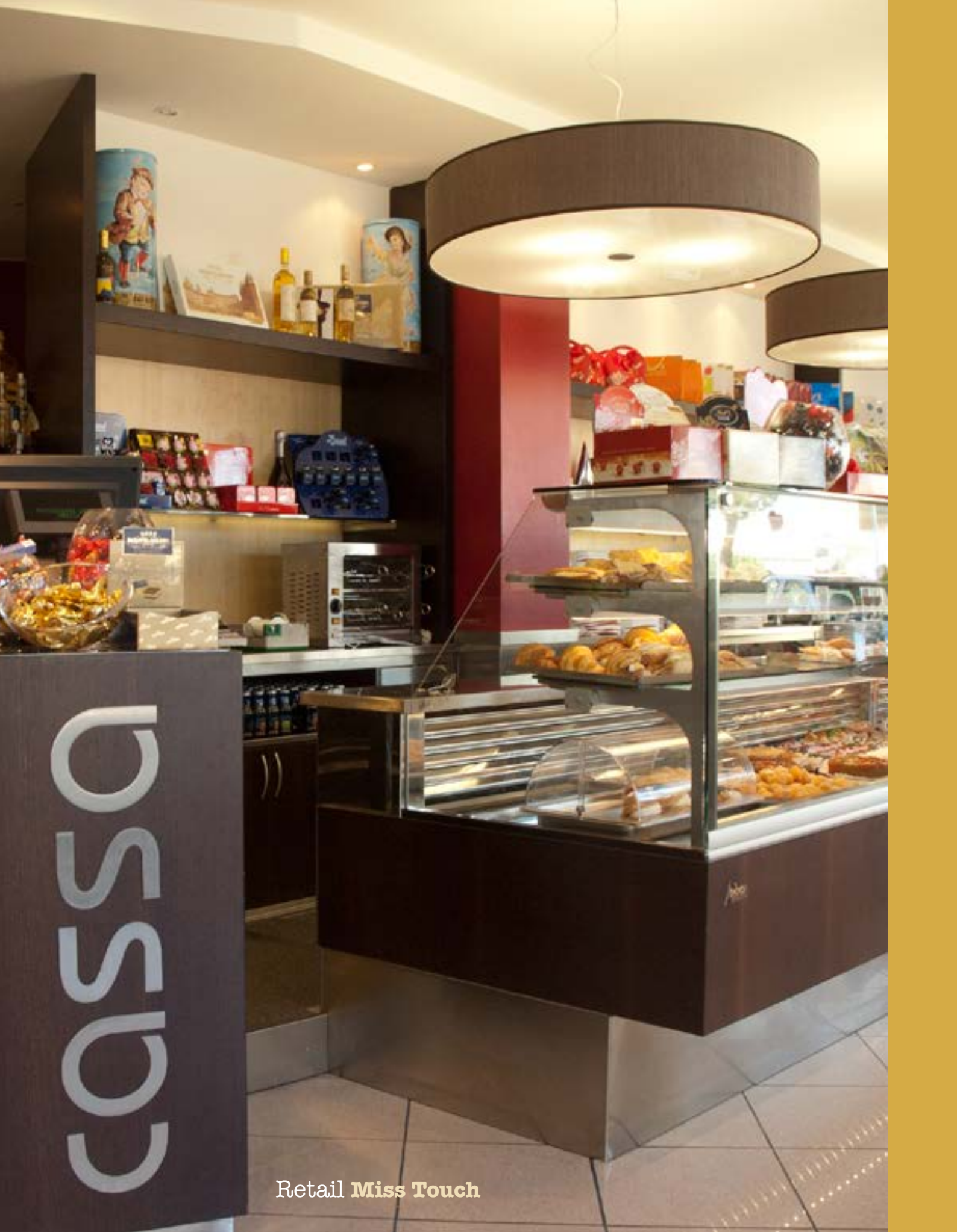
Retail Miss Touch